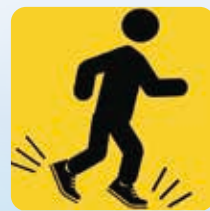
すべりにくい靴の着用