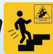
危険箇所の見える化